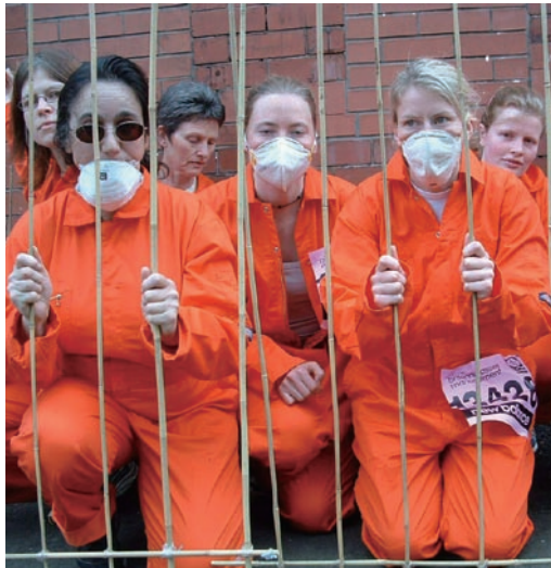
AI / Pierre Gleizes

Close down the Guantanamo detention facilities. End all secret detentions.